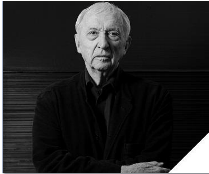
© Pierre Soulages, photographie Christian Bousquet. (Musée Soulages - don des amis du musée Soulages)

C est beaucoup d'exaltation et d'honneur qu'un artiste sollicité par le monde entier, et exposé au Musée du Louvre à l'occasion de son centième anniversaire, dans le Salon carré où l'on a décroché pour lui la Maestà sacrée au fond d'or de Cimabue , le Saint François d'Assise de Giotto ou encore les chevaux de La Bataille de San Romano de Paolo Uccello, ait eu la générosité de dire oui au Printemps des Poètes 2020 .